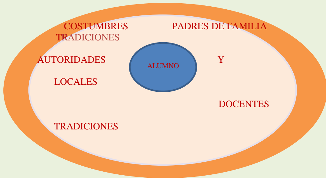
Figura 1.- Elaboración propia.

estructurando tanto su corporeidad como su personalidad en coherencia con los dictámenes de la cultura local.