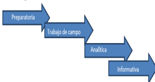
Figura 4. Fases de la investigación cualitativa en la segunda etapa.

Como ya hemos mencionado, la metodología a utilizar durante esta segunda etapa es cualitativa. Las fases que considera la investigación cualitativa son cuatro, según Rodríguez, Gil & García (1997), y se enuncian de acuerdo a la siguiente figura.