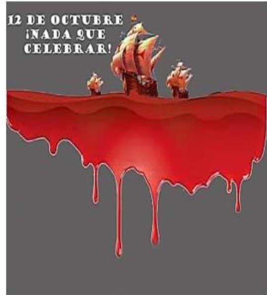
Figura 2. Realizado por la autora de la investigaci3n